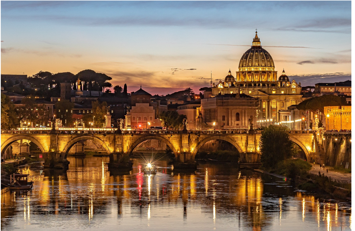
Tiber, Brücke, Petersdom – natürlich in Rom

überaus vielfältig geworden und bietet neben der Arbeit an der Sprache eine ganze Fülle von Themen, die auch für Schüler unserer Zeit interessant und faszinierend sind.