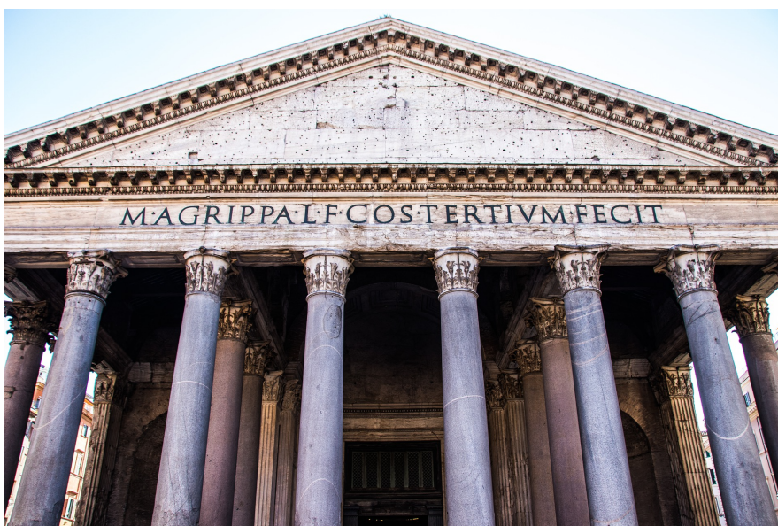
Der Eingang zum Pantheon in Rom

In der Oberstufe bestimmen die Texte der römischen Autoren den Inhalt, z.B. geht es bei Plinius um den Ausbruch des Vesuv oder um den Alltag eines römischen Senators oder um die sinnvolle Gestaltung der Freizeit. Bei Ovid geht es um zutiefst menschliche Geschichten aus der griechischen Mythologie oder um die Wirrungen der Liebe, bei Seneca um den Umgang mit Sklaven, um das Verhältnis zu den Mitmenschen und um den Umgang mit dem Tod – die Inhalte und Themen sind in der Oberstufe genauso vielfältig wie die Texte, die wir lesen.