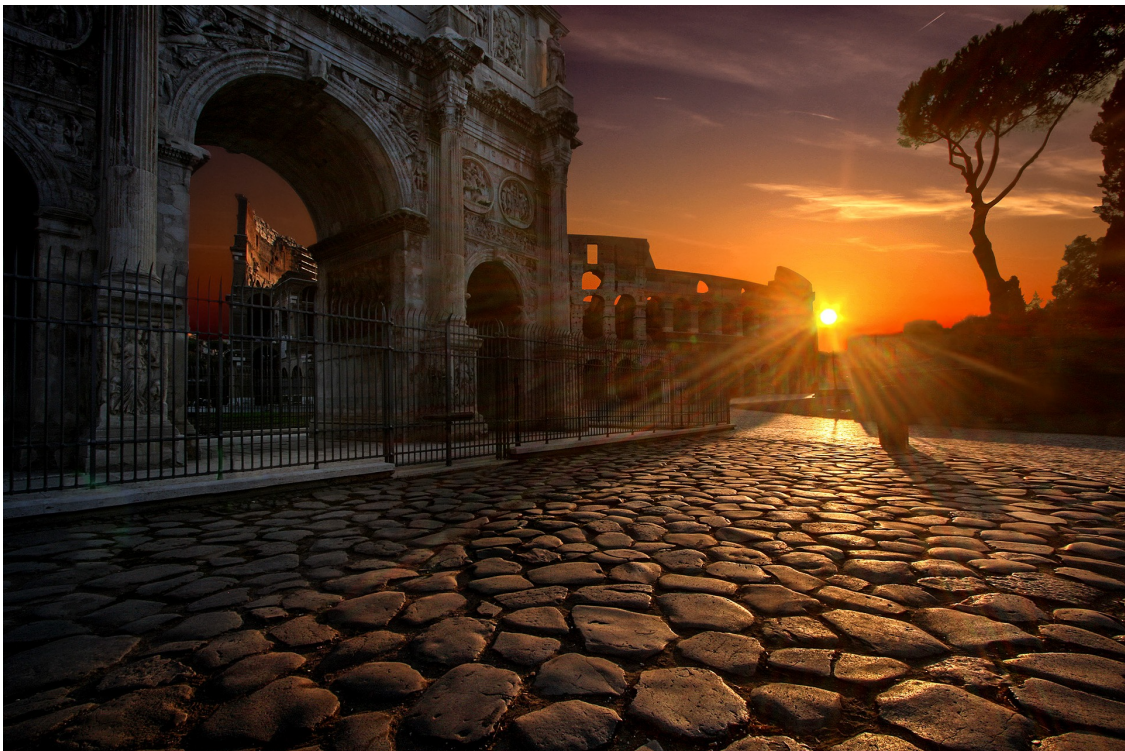
Der Konstantinsbogen in Rom