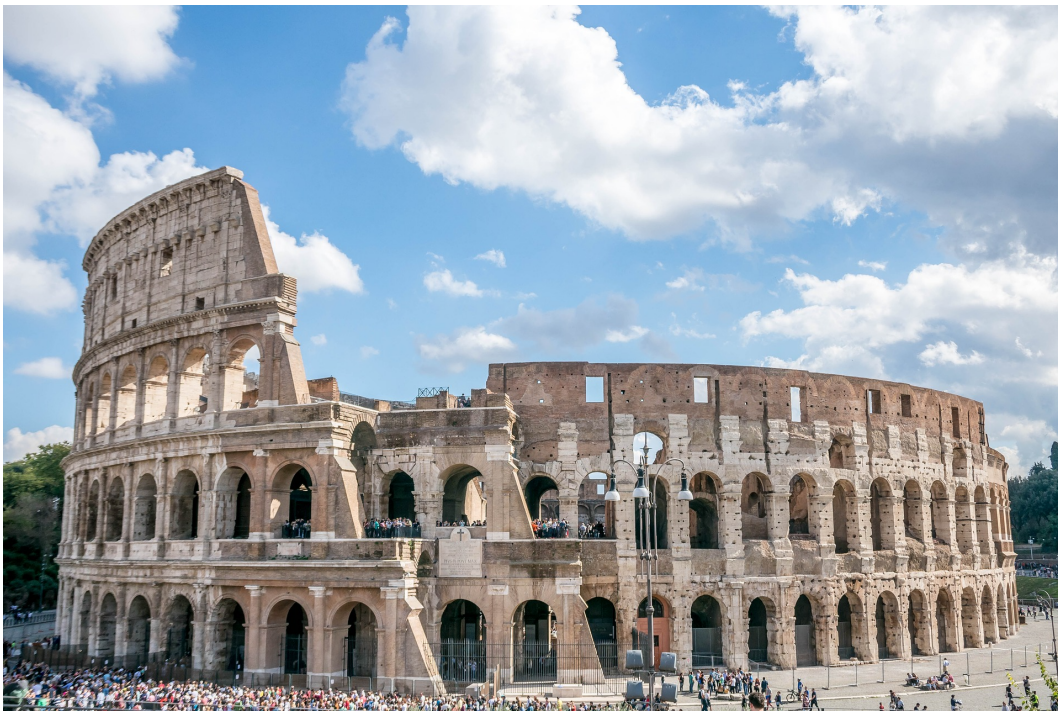
Das Kolosseum in Rom

Unabhängig davon, ob Latein als 2. oder als 3. Fremdsprache gelernt wird, hat jeder Schüler die Möglichkeit, einen qualifizierten Abschluss, nämlich das Latinum zu machen, das für viele Studiengänge verbindlich ist.